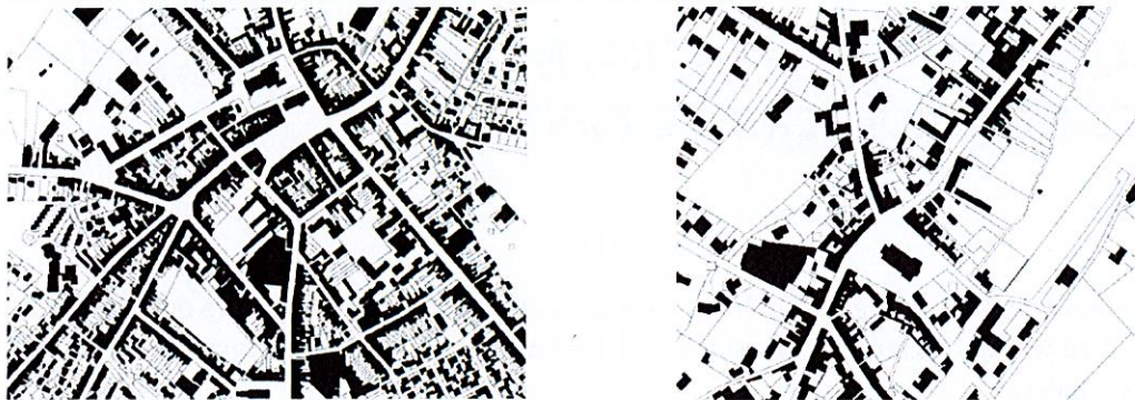
Extrait cadastral représentatif des cœurs de villes et de villages